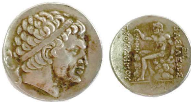
1-расм. Диодот кумуш тетрадрахмаси.

банд) (Ртвеладзе, 1976. С. 100) ва воҳанинг маркази Ялангтўштепа жойлашган. Ялангтўштепа, Ту-манкўрғон ёдгорликларида эрамиздан аввалги III–II асрлар маданий қатламлари қайд этилган (Горин, 2011. С. 80–112) ва шу боис, ёдгорликларда маҳаллий аҳоли томонидан тангалар ҳам топилган. Юнон-Бақтрия шоҳи Диодотнинг кумуш тетрадрахмаси булар сирасидандир (1-расм). Бандихон воҳасида илк темир асридан сунъий суғориш тизими