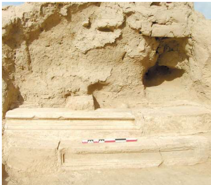
3-расм. Эски Термиз. Чингиз-2.

Э. В. Ртвеладзе фикрича, “Сурагана” топоними икки компонентдан таркиб торган яъни “сур” ва “ган” дан. “Сур”ни туркий “саур/соур” сўзи билан боғлаб, уни “от туёғи”, “от туёғига ўхшаш тоғ” ёки санскритча “suria (sūr)”-қуёш худоси, деб изоҳлаган. Шу асосда муаллиф “Сурагана” топонимини туркий-бактрия сўзлари бирикмасидан таркиб топган “тоғдаги кон” ёки санскритча “худолар маскани”, деб талкин этган (Ртвеладзе, 2021. С. 295–297). Сурагана таркибидаги “сур” сўзининг яна бир муҳим маъноси бор. XX асрнинг 50–80 йилларида Термиз туманининг кўп сонли қўй отарлари айти шу Хўжа Гулсуярнинг икки тарафида, хусусан Тузкон қўлидан Хотинработ ва ундан Амударё